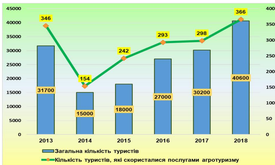
Рис. 3. Кількість туристів, які відвідали Жовківський район та скористалися послугами сільського туризму та агротуризму у 2013–2018 рр.

Отримані інформаційні дані від Жовківської районної державної адміністрації (відділ культури, молоді та спорту) свідчать про те, що кількість вітчизняних та іноземних туристів, які відвідали Жовківський район, змінювалася за період 2013–2018 рр. (табл. 2).