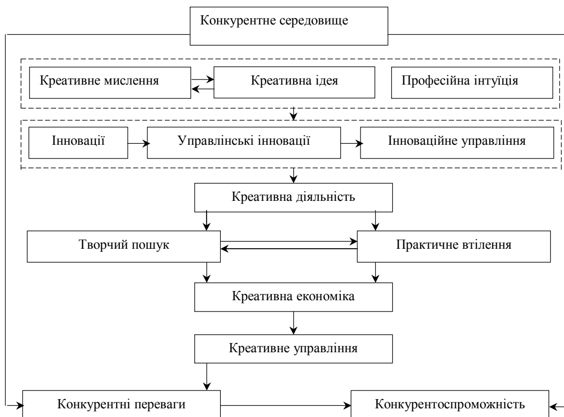
Рис. 2. Модель інноваційно-креативного управління конкурентоспроможністю фермерських господарств

Висновки. Для підвищення конкурентоспроможності фермерських господарств особливу увагу приділяють інноваціям, зокрема в системі управління. Впровадження інновацій у виробничий та управлінський процес стає можливим за рахунок креативності – здатності генерувати нові ідеї та способи ефективного вирішення проблем.