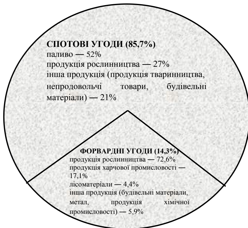
Рис. 2. Обсяги біржової торгівлі за видами угод у 2014 році.

угоди з продукцією рослинництва (72,6 %), харчовими продуктами (17,1 %), лісоматеріалами (4,4 %), іншою продукцією (5,9 %).