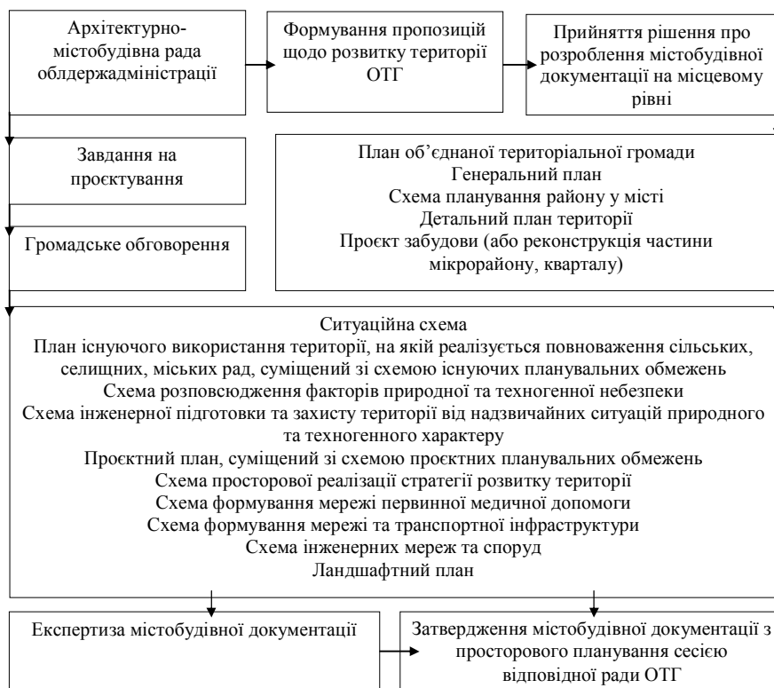
Рис. 1. Інституційна схема планування територій ОТГ на місцевому рівні

забезпечення об'єднаних територіальних громад єдиною документацією із просторового планування, розширення повноважень органів місцевого самоврядування щодо регулювання забудови, забезпечення зв'язку програм соціально-економічного розвитку з документацією з просторового планування. Позитивним є те, що запровадження нових підходів при розробленні документації з просторового планування територій ОТГ, удосконалення їх структури забезпечує перехід від функціонального розподілу території землекористування до планування сталого розвитку територій у майбутньому. Таким чином, запроваджено новий вид містобудівної документації на місцевому рівні, а саме плану об'єднаної територіальної громади. На території ОТГ, як у межах, так і за межами населених пунктів, категорію земель та вид цільового призначення земельної ділянки визначають у межах відповідного виду функціонального призначення території, що передбачено згідно із затвердженим комплексним планом просторового розвитку території територіальної громади або генеральним планом населеного пункту [3]. Це спростить процедуру зміни цільового призначення земельних ділянок, а також вирішить проблему неузгодженості земельного та містобудівного законодавства завдяки розробленню класифікатора функціонального призначення територій, що буде узгодженим із класифікатором цільового призначення земельних ділянок.