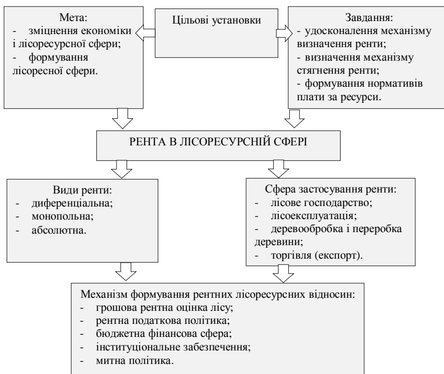
Рис. 1. Схема формування механізму рентних відносин у лісоресурсній сфері

Лісоресурсна рента як економічна категорія характеризує будь-який дохід, що регулярно отримується із земель лісового фонду і лісових ресурсів як капіталу, що безпосередньо не залежить від підприємницької лісогосподарської діяльності, а лісоресурсний рентний дохід – це додатковий дохід від використання земель лісового фонду і лісових насаджень як ресурсів природи, прикладання праці і капіталу, який виникає за рахунок використання лісових ресурсів, що є власністю держави чи будь-якої юридичної (фізичної) особи. При цьому лісоресурсна рента забезпечує своїм власникам одержання відповідного додаткового доходу, який, по суті, являє собою юридичне вираження ренти лісових ресурсів. Частина його держава вилучає у вигляді орендної плати або податку на додатковий дохід з більш високою ставкою між податком на прибуток. Ці кошти надходять до бюджету держави і перерозподіляються на різні соціальні програми.