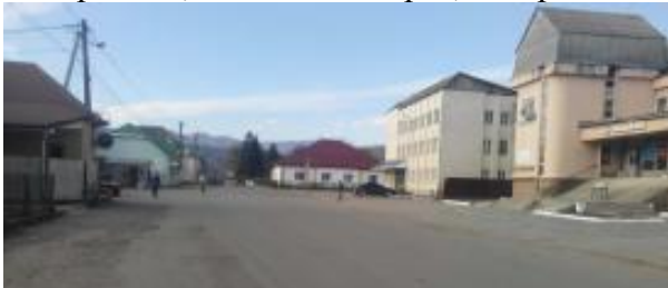
Рис. 4. с. Керецьки (Свалявський р-н, Закарпатська обл.)

Громадський центр як єдиний композиційний вузол створено у с. Керецьки, Свалявський р-н, Закарпатська область (рис. 4).