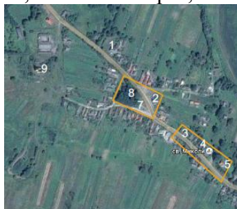
Рис. 2. с. Соколівка, Жидачівський р-н, Львівська обл.