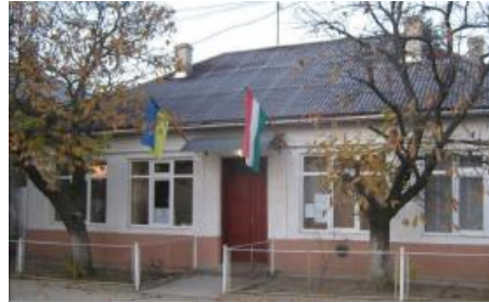
Рис. 7. Сільська рада, с. Мужієво (Берегівський р-н, Закарпатська обл.)

Громадські будівлі сільських поселень, такі як клуб, або Будинок Просвіти, торгові центри, як правило, розташовані біля головної вулиці. Біля торгових центрів відсутній поділ території на господарську та пішохідні зони. Територія будівель громадського призначення не виділяється характерним благоустроєм. Біля торгових центрів відсутній поділ території на господарську та пішохідні зони.