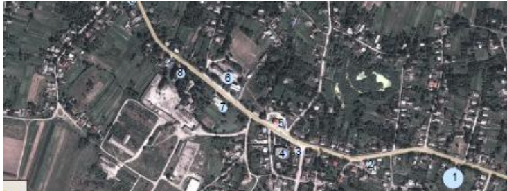
Рис. 3. с. Озоряни, Борщівський р-н, Тернопільська обл.

Громадський центр як єдиний композиційний вузол створено у с. Керецьки, Свалявський р-н, Закарпатська область (рис. 4).