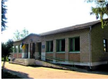
Рис. 6. Сільрада, с. Кустин (Рівненський р-н, Рівненська обл.)