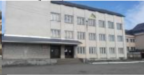
Рис. 5. Будівля лікарні в с. Керецьки (Свалявський р-н, Закарпатська обл.)

На території центру зосереджені громадські будівлі – адмінбудинок, торговий центр, лікарня та бібліотека. Цікавим є факт, що перший поверх будівлі лікарні займають приміщення адміністрації поселення (рис. 5). На центральній частині села не виділено пішохідної зони. Функції площі для проведення масових заходів виконує головна вулиця поселення.